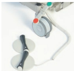
Fodpedal til indstilling